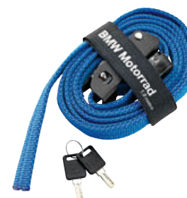
6 Cinta de sujeción para rollo de equipaje Atacama, con cierre