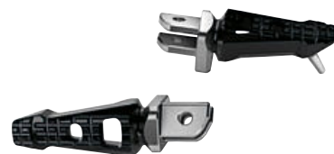
3 Reposapiés ajustable