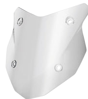
6 Parabrisas Sport