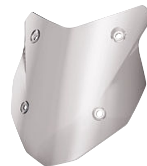
7 Parabrisas Sport tintado