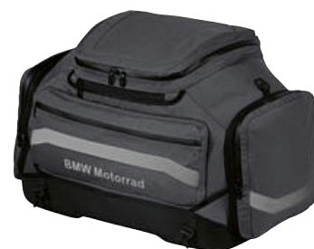
3 Softbag grande