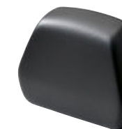
7 Respaldo acolchado para Topcase pequeño