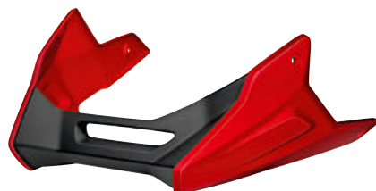
4 Spoiler del motor en Rojo Racing liso