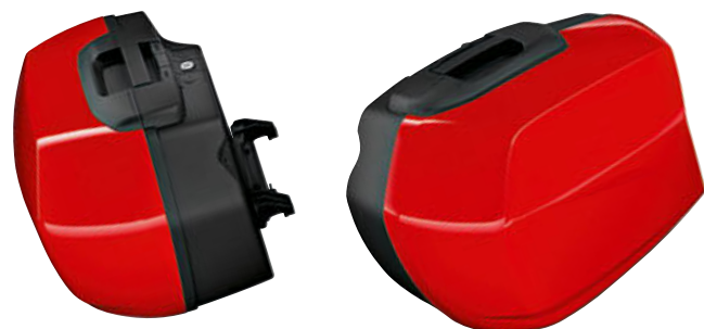
1 Maleta de viaje