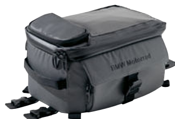
2 Mochila para el depósito pequeña