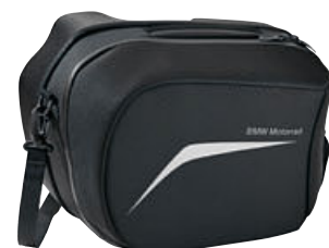
2 Bolsa interior para maleta de viaje, lado izquierdo