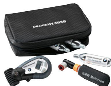
2 Set de viaje para presión de inflado de los neumáticos