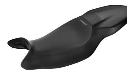
9 Asiento alto