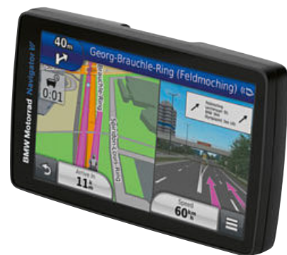
1 BMW Motorrad Navigator VI