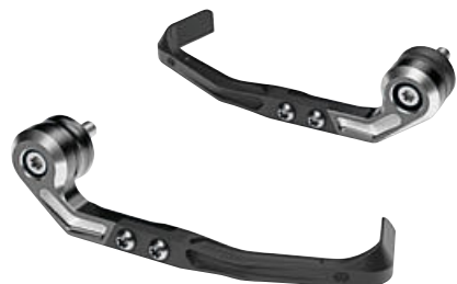
2 Protector de maneta de freno Protector de maneta de embrague