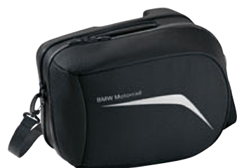
3 Bolsa interior para maleta de viaje, lado derecho