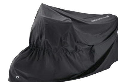
6 Cubierta de lona para vehículo