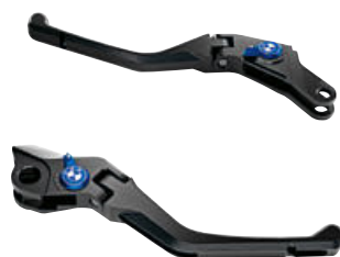
1 Maneta del freno plegable Maneta de embrague plegable