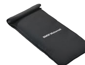
8 Bolsa para smartphone