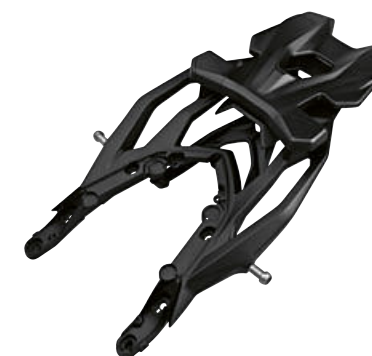
9 Puente portaequipajes