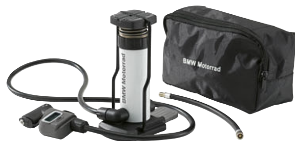
4 Minibomba de pie

Ya sea motocicleta, automóvil, bicicleta, balón de fútbol o colchoneta: la minibomba de pie de BMW se adapta a todas las válvulas y bombea con gran precisión gracias al manómetro digital.