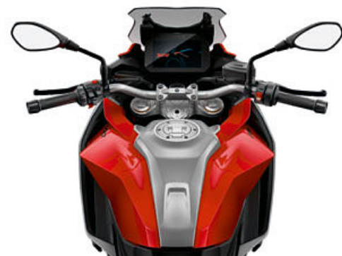
ORO GALVÁNICO MET.