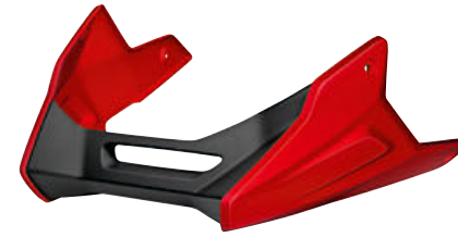
6 Spoiler del motor en Rojo Racing liso