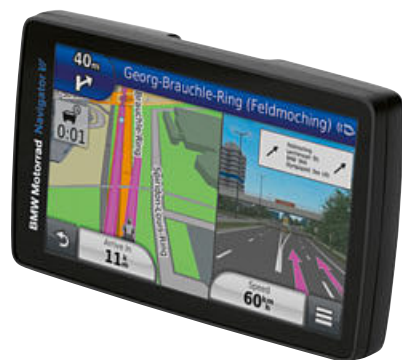
1 BMW Motorrad Navigator VI