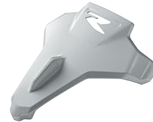
9 Cubierta del asiento del acompañante Plata Hockenheim metalizado