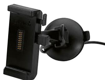
3 Car Kit para BMW Motorrad Navigator VI