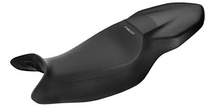
5 Asiento alto