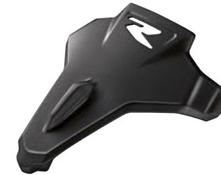
10 Cubierta del asiento del acompañante Negro tormenta metalizado