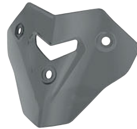
2 Parabrisas Pure