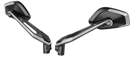
1 Retrovisor HP