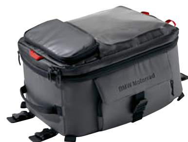
1 Mochila para el depósito grande