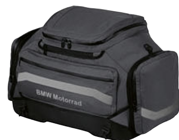
3 Softbag grande