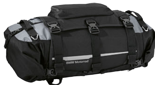
5 Rollo de equipaje Atacama