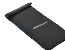
8 Bolsa para smartphone