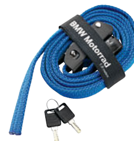
6 Cinta de sujeción para rollo de equipaje Atacama, con cierre