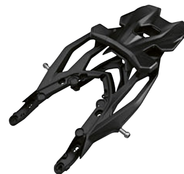
6 Puente portaequipajes