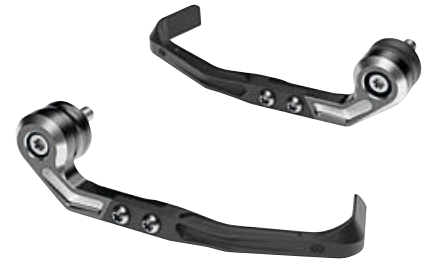
4 Protector de maneta de freno Protector de maneta de embrague