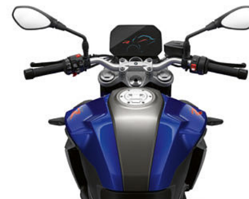
BMW F 900 R Negro Tormenta metalizado