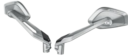
2 Retrovisor plateado Option 719