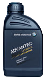
3 Aceite para motor original BMW ADVANTEC Ultimate 5W-40, 500 ml