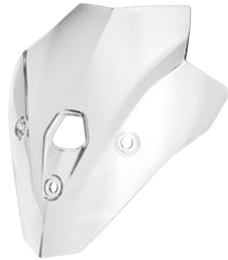
1 Parabrisas alto