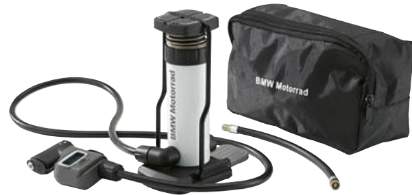
4 Minibomba de pie