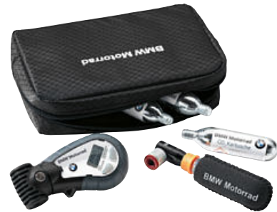
2 Set de viaje para presión de inflado de los neumáticos