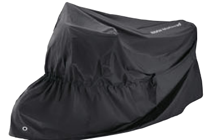
6 Cubierta de lona para vehículo