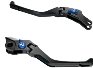
3 Maneta del freno plegable Maneta de embrague plegable