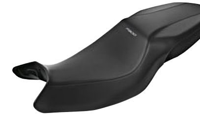
4 Asiento confort