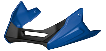
8 Spoiler del motor en Azul metalizado San Marino