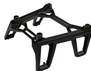
2 Portamaletas para maleta blanda