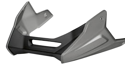
7 Spoiler del motor en Gris granito metalizado mate