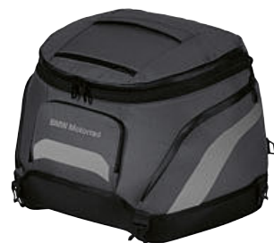
4 Softbag pequeño