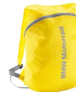
9 Mochila plegable