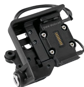
2 Kit de reequipamiento de la preparación para el sistema de navegación