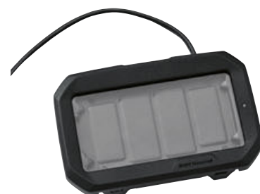
4 Base de smartphone BMW Motorrad