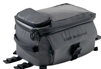
2 Mochila para el depósito pequeña